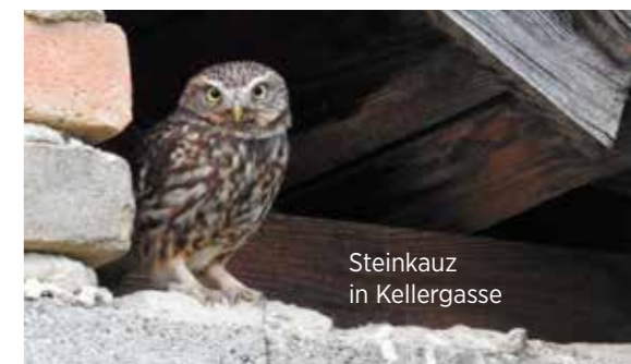
Steinkauz in Kellergasse