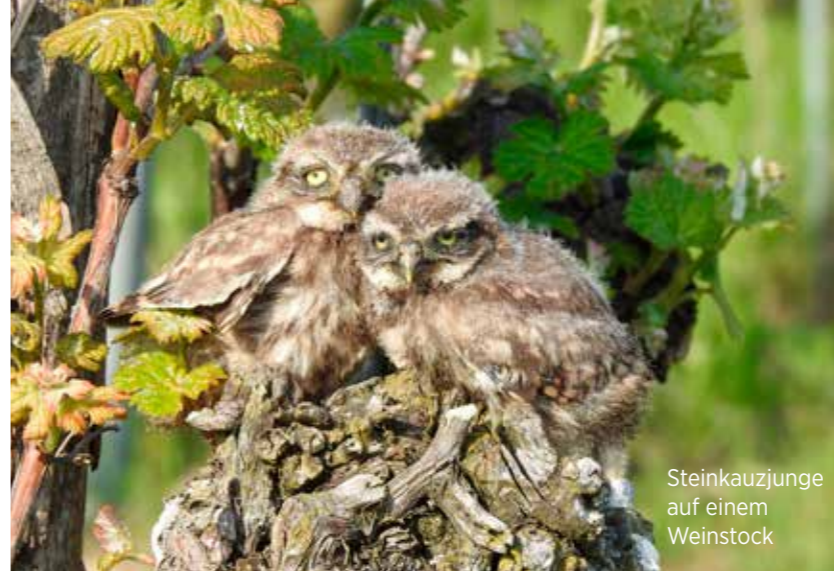
Steinkauzjunge auf einem Weinstock