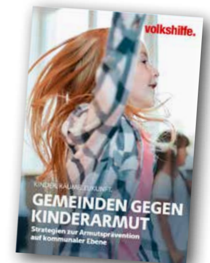
Gefördert aus den Mitteln des Bundesministeriums für Arbeit, Soziales, Gesundheit, Pflege und Konsumentenschutz