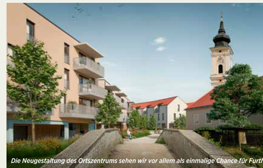
Die Neugestaltung des Ortszentrums sehen wir vor allem als einmalige Chance für Furth

Die Sorgen, die in der Anrainerschaft bezüglich Hochwasser und Grundwasser bestehen, sind wie bereits erwähnt, verständlich. Wir sind aber durch viele Gespräche mit Expert:innen davon überzeugt, dass dem Urteil der Sachverständigen, die für wasserrechtliche Bewilligungen zuständig sind, vertraut werden kann und auch muss. Wir leben in einer Zeit, in der gerade solche Fragestellungen besonders genau geprüft werden. Auch die angesprochenen Sorgen haben sicher zu einer noch ausführlicheren Prüfung geführt. Den Beurteilungen kann man also aus unserer Sicht vertrauen. Im Zusammenhang mit Hochwasser spielt die Größe der versiegelten Fläche immer eine wesentliche Rolle. Was man nicht auf den ersten Blick für möglich halten mag, ist, dass die versiegelte Fläche nach Bauabschluss weniger sein wird, als sie das davor war. Einen wesentlichen Beitrag dazu leisten die Gründächer der Wohngebäude